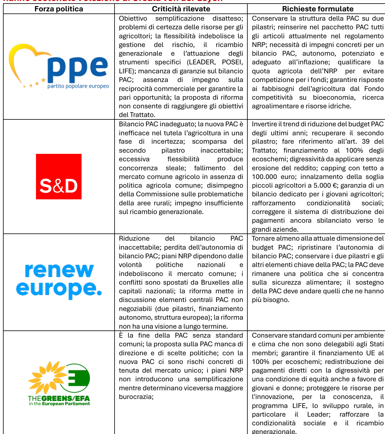
Tabella 1 – Le posizioni politiche sulla proposta di riforma PAC 2028-2034: i gruppi che hanno sostenuto l'elezione di Ursula von der Leyen

18 febbraio 2026 sono stati analizzati i contenuti del parere della Corte dei conti europea. Il 22 gennaio 2026 anche la plenaria del Comitato Economico e Sociale Europeo (CESE) ha approvato un proprio parere sulla proposta di riforma della PAC 2028-2034.