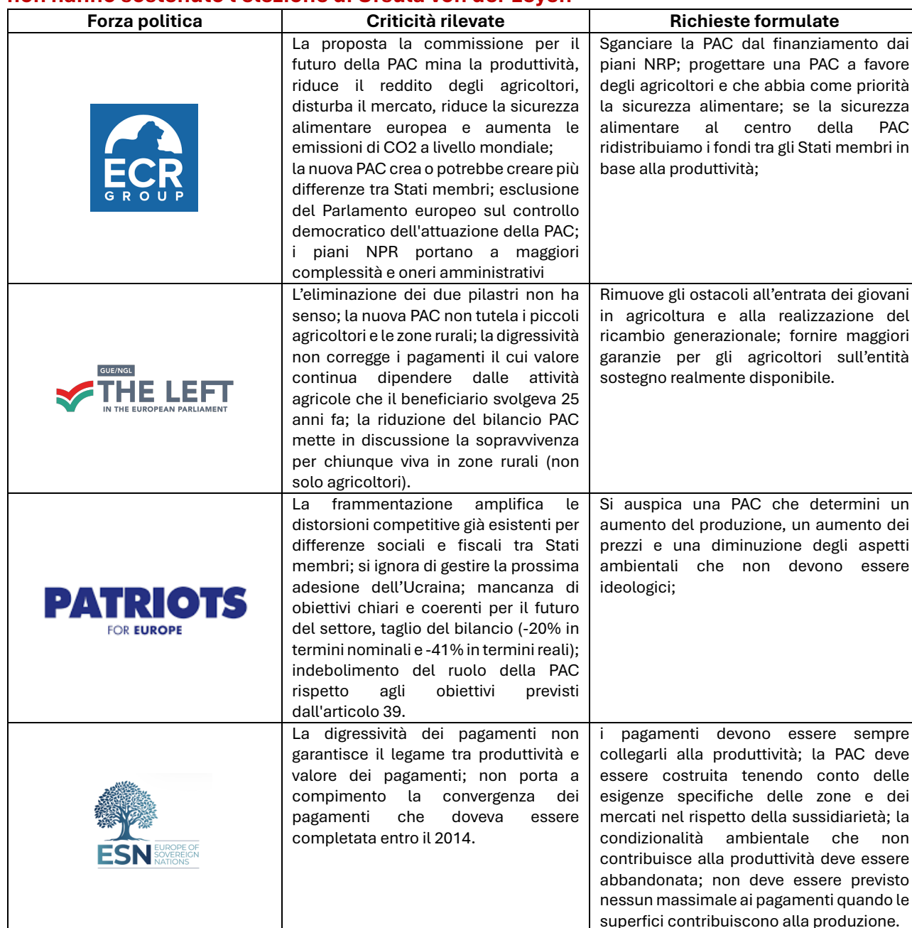
Tabella 2 – Le posizioni politiche sulla proposta di riforma PAC 2028-2034: i gruppi che non hanno sostenuto l'elezione di Ursula von der Leyen

agricoltori come "numeri su fogli Excel" e imponendo una "condizionalità ambientale" ideologica che non contribuisce alla produzione. Infine ESN lamenta che i pagamenti sono ancora basati su modelli storici obsoleti degli anni '80, senza aver mai raggiunto la parità di condizioni tra vecchi e nuovi Stati membri.